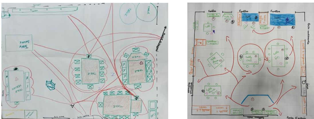
Réflexion en équipe sur l'aménagement de l'espace

Nous avons aussi organisé une journée de formation à l'attention de l'ensemble des directions de la petite enfance de la Commune d'Onex. Cette journée a été riche en échanges et pour y donner une suite, nous avons déjà été sollicités par 2 directions pour que nous venions former directement leurs équipes.